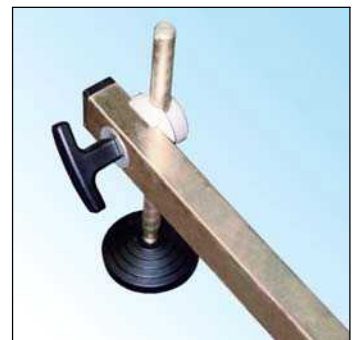
równik poziomemu masztu